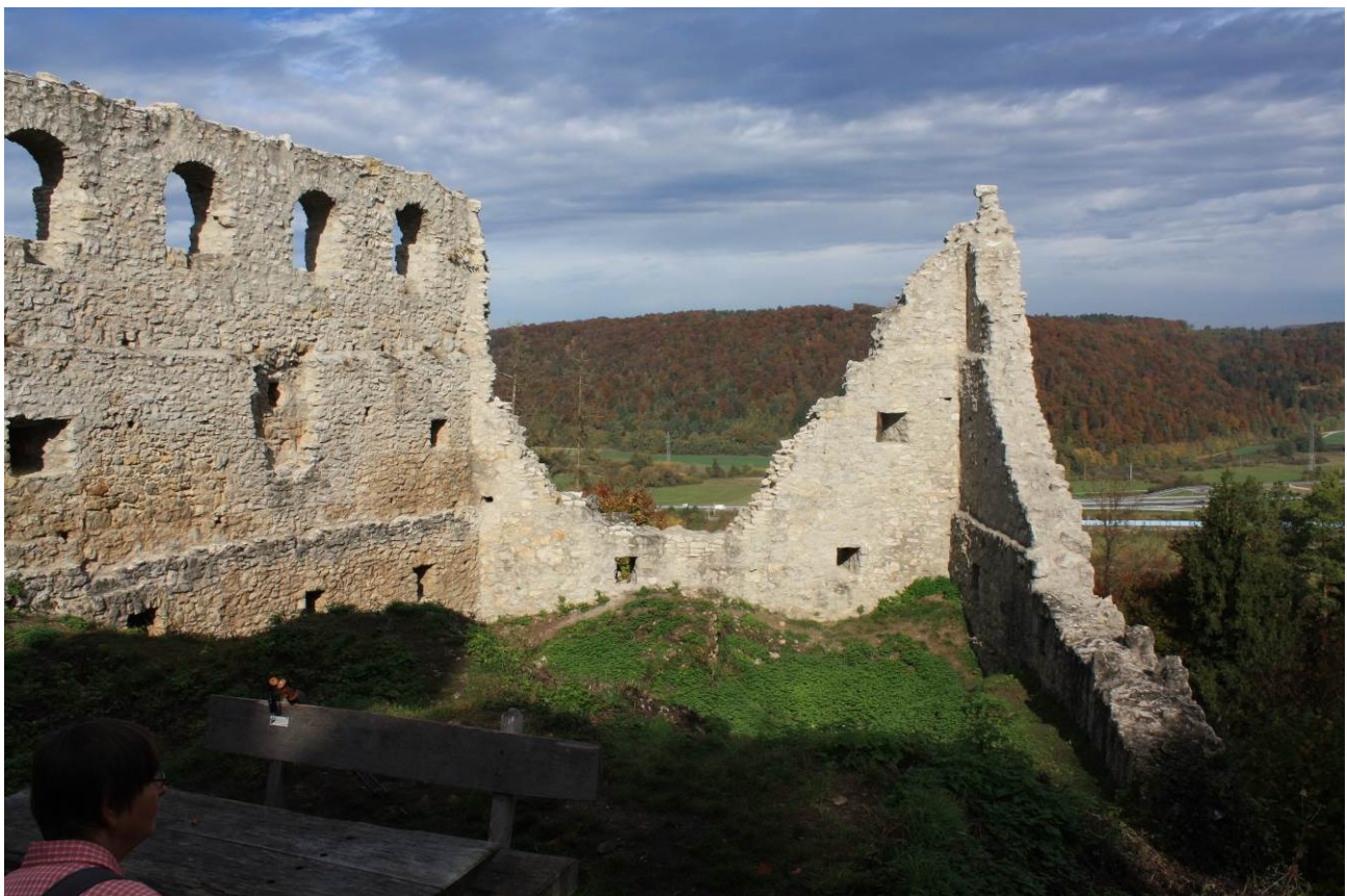
Ruine Rumburg oberhalb Enkering (21.10.2019)

Bei den Touren ist Rucksackvesper vorgesehen und eine Kaffeepause gegen Ende der Wanderung eingeplant (Ausnahme Sonntag: zusätzlich Mittagseinkehr am Kratzmühlsee). Einkaufsmöglichkeiten (kleiner Einkaufsmarkt, Bäcker & Metzger) gibt es direkt gegenüber dem Hotel in Kinding.