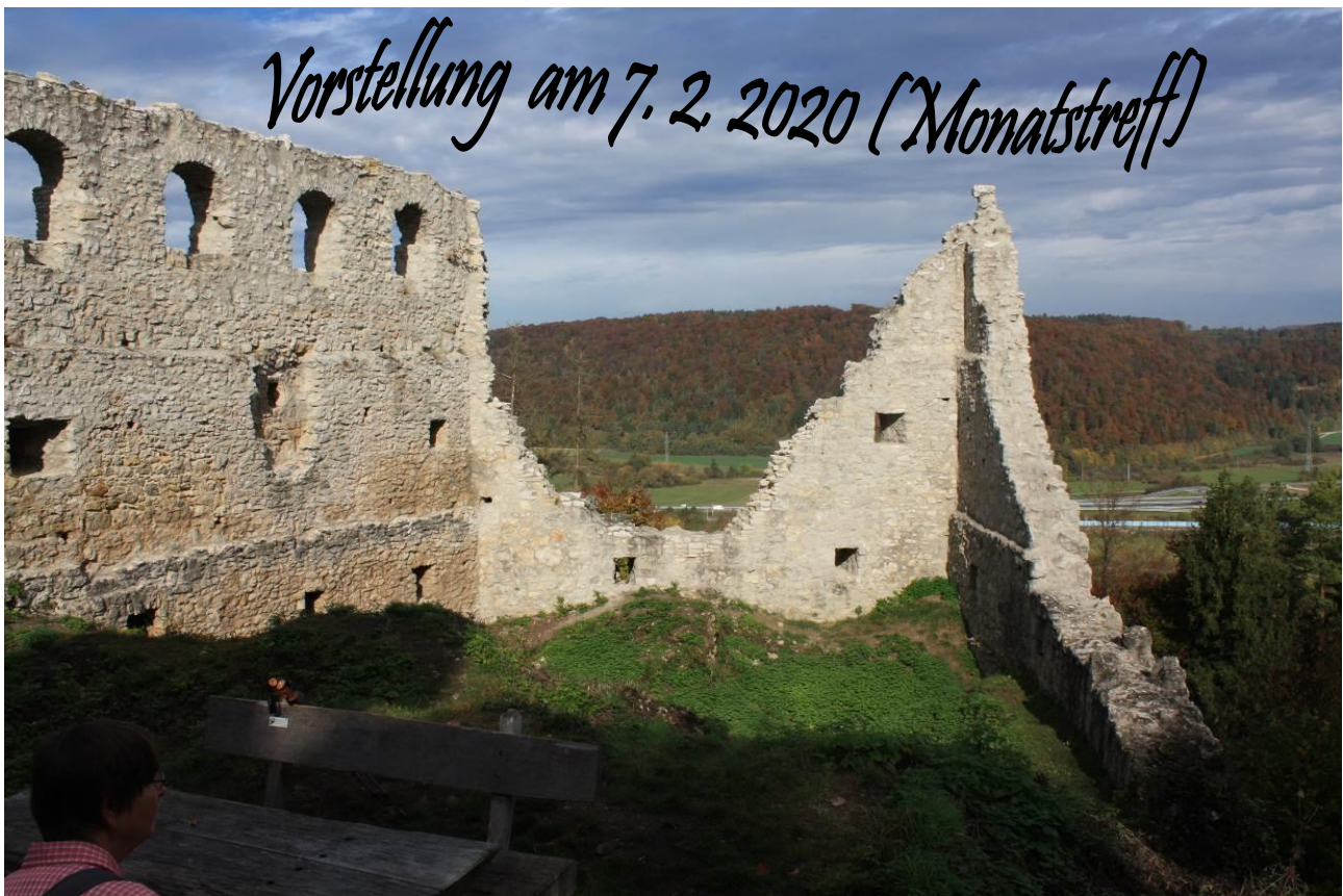
Ruine Rumburg oberhalb Enkering (21.10.2019)

Bei den Touren ist Rucksackvesper vorgesehen und eine Kaffeepause gegen Ende der Wanderung eingeplant (Ausnahme Sonntag: zusätzlich Mittagseinkehr am Kratzmühlsee). Einkaufsmöglichkeiten (kleiner Einkaufsmarkt, Bäcker & Metzger) gibt es direkt gegenüber dem Hotel in Kinding.