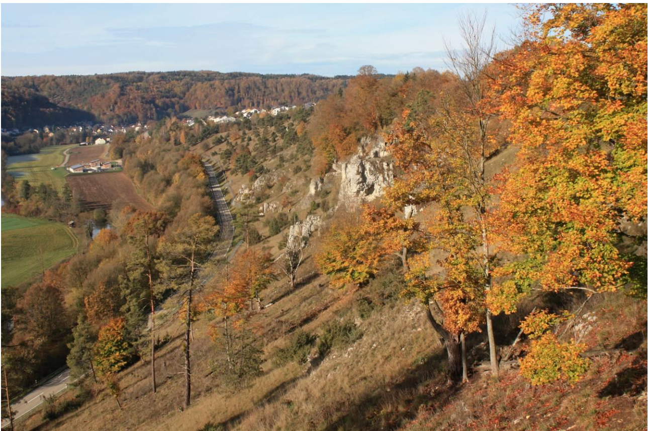
Altmühltal bei Solnhofen (31.10.2018)

Bei den Touren ist Rucksackvesper vorgesehen und eine Kaffeepause gegen Ende der Wanderung eingeplant (Ausnahme Samstag: Mittagseinkehr am Kiosk Hammermühle).