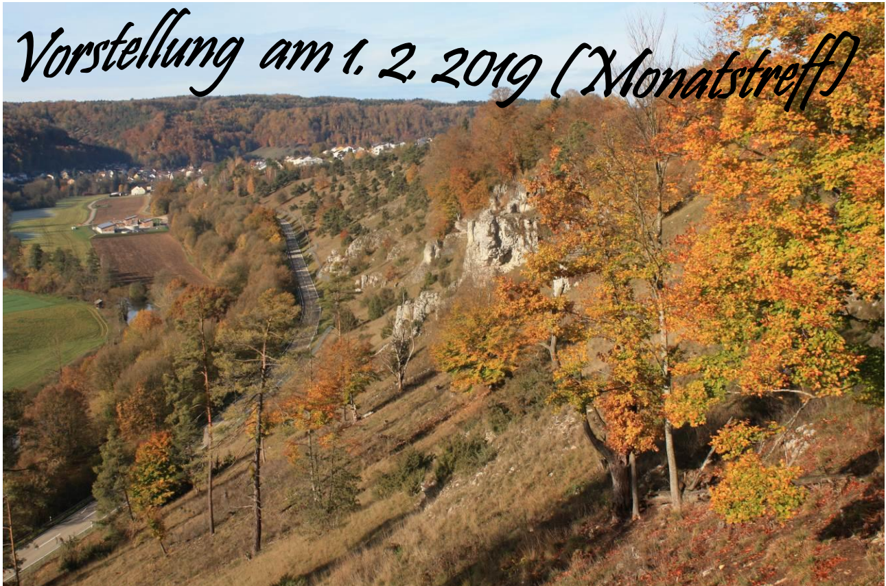
Altmühltal bei Solnhofen (31.10.2018)

Bei den Touren ist Rucksackvesper vorgesehen und eine Kaffeepause gegen Ende der Wanderung eingeplant (Ausnahme Samstag: Mittagseinkehr am Kiosk Hammermühle).