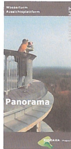
Schorfheide Joachimsthal Biorama Projekt